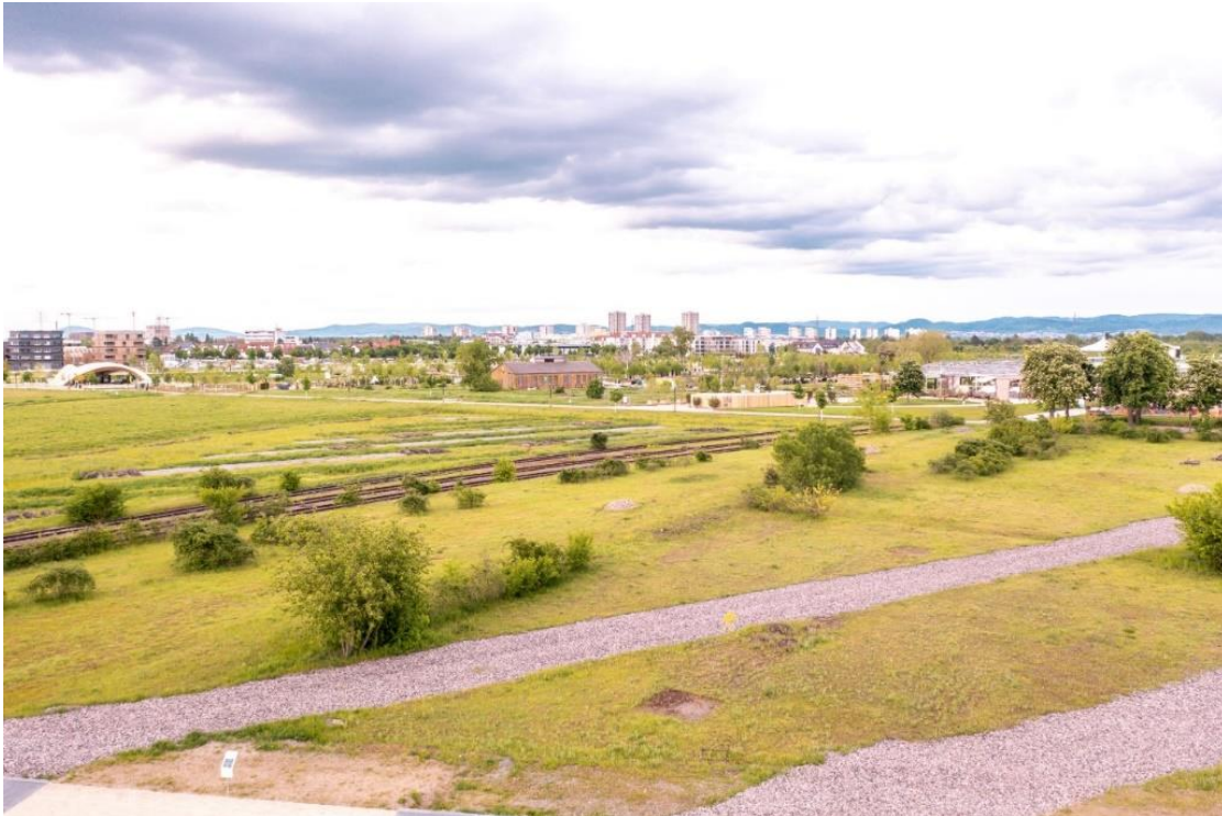
Drohnenfotos Klimapark West