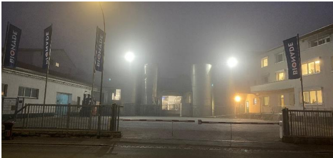
BIONADE Standort vorher bei Nacht