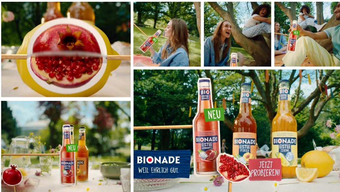
BIONADE Spot „Volltreffer“ inklusive Eistee Granatapfel

Die bestehenden Sorten Pfirsich und Zitrone bilden das erfolgreiche Fundament der BIONADE Premium-Eistees und sorgen für Wiedererkennung im Markt. Die neue Sorte Granatapfel erweitert das Sortiment um eine intensiv-fruchtige Geschmacksrichtung und übernimmt innerhalb der Kampagne die Rolle des zentralen Impulsgebers. Das Motto „Volltreffer“ des bestehenden, wirksamen und auf BIONADE-Art wieder genutzten Spots ( Unser (fast) neuer Spot! ) könnte nicht besser zur neuen Sorte passen. Er spiegelt relevante Eistee-Verwendungssituationen und inszeniert die Bio-Eistees als verbindende und spaßige alkoholfreie Alternative. Gleichzeitig vermittelt er Leichtigkeit und Frische und macht deutlich Lust auf den neuen Eistee Granatapfel.