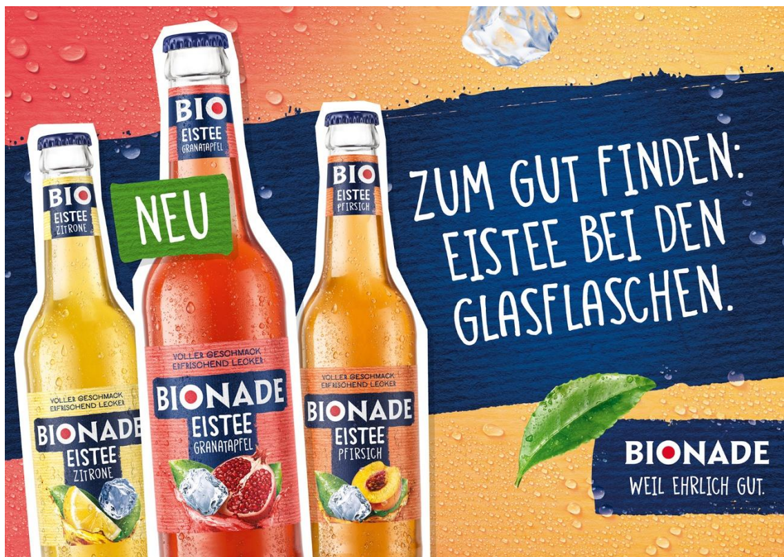
BIONADE POS-Plakat der Premium-Eistee-Range